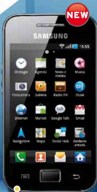
SAMSUNG GALAXY ACE