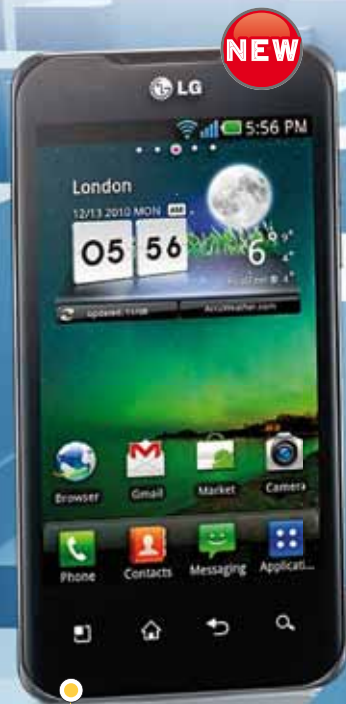
LG OPTIMUS DUAL